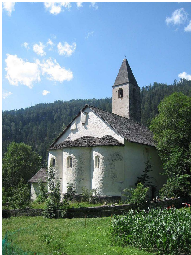
Karolinger Kirche von Mistail und Innenansicht der Reformierten Kirche Cazis