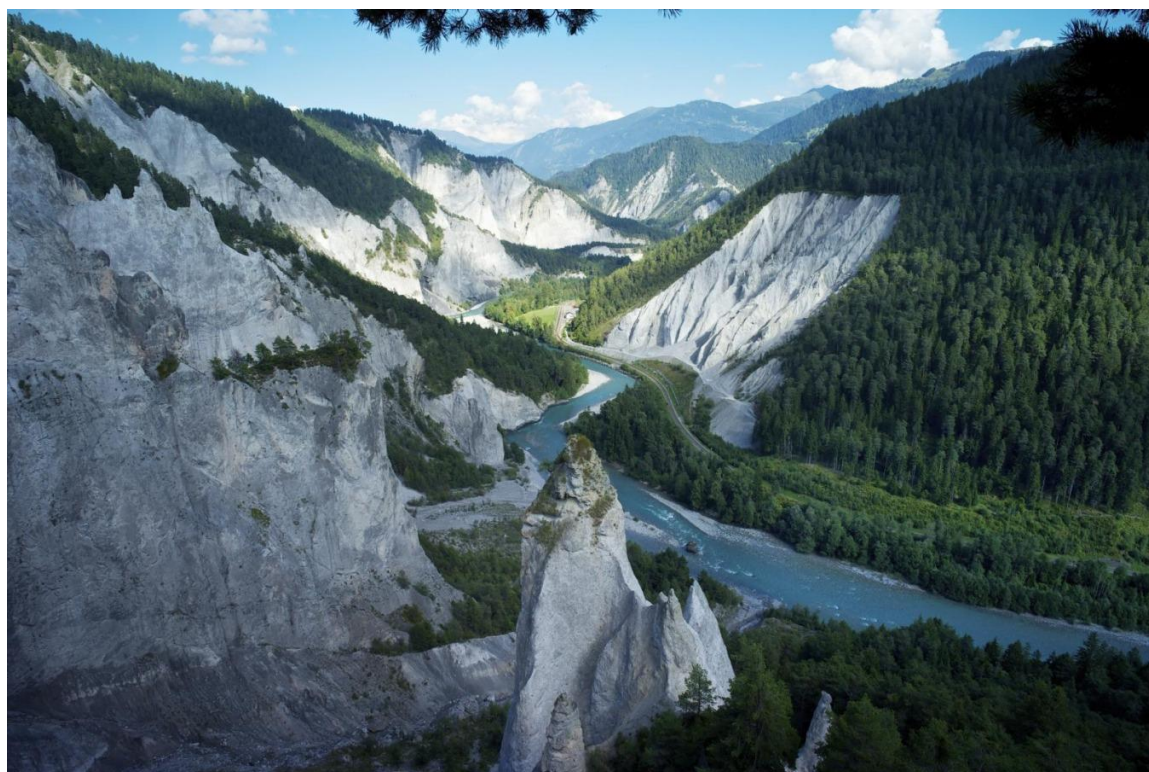
Blick in die Ruinalta, entstanden durch den Flimser Bergsturz.